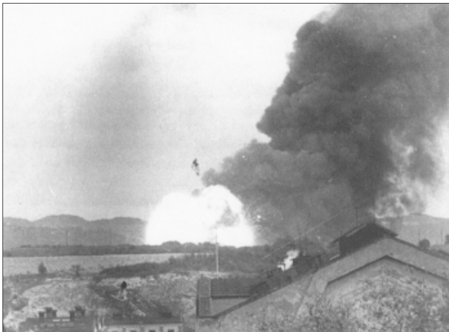
Výbuch muničního skladu v Krásném Březně

Skončila válka, v Ústí nad Labem a jeho okolí se povalovalo značné množství válečného materiálu včetně munice. Zůstala zde také kvanta luxusního zboží, nejen po konfiskovaných obchodech, ale i po bohatých rodinách, především židovského původu, které před nacisty prchaly do zahraničí ještě