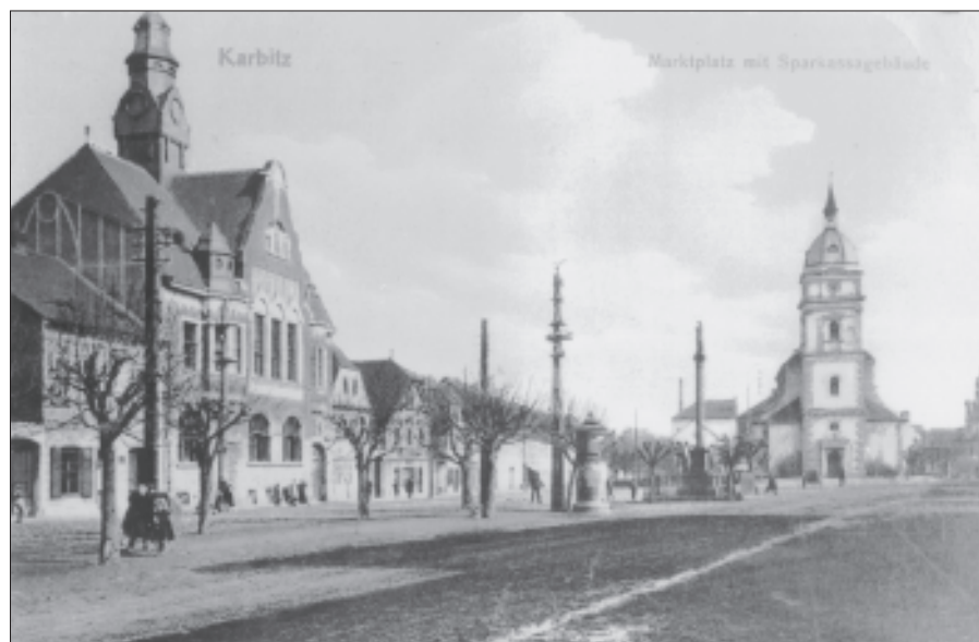
Náměstí Chabařovic s výlepovou plochou plakátů v místech, kde byla letos obnovena

písemných pramenech. První záznamy pocházejí z pera městského písaře. Ten patřil