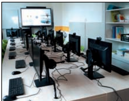
Učebna pro výuku jazyků v ZŠ Tisá