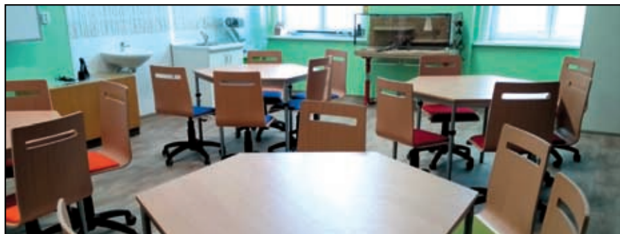
Odborná učebna přírodních věd v ZŠ Petrovice