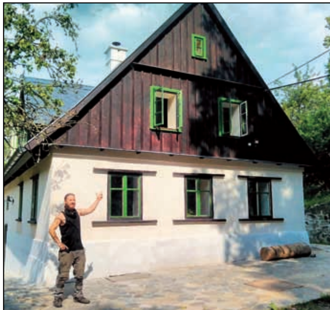
Ubytování ve vesnické památkové zóně Merboltice

zařízení, včetně knihoven. Podpořili jsme tak několik kluboven pro spolkové a kulturní setkávání a městské knihovny v Benešově n.PI a v Jílovém.