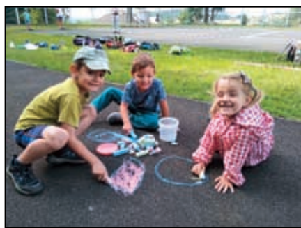
Příměstský tábor Tisá

Komunitní centrum Povrch v letošním roce, kdy je setkávání na komunitní úrovni v důsledku covidové pandemie omeze-