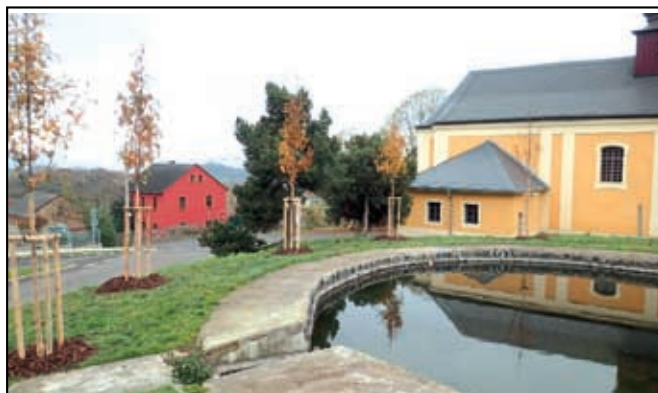
Výsadba na návsi v Javorech