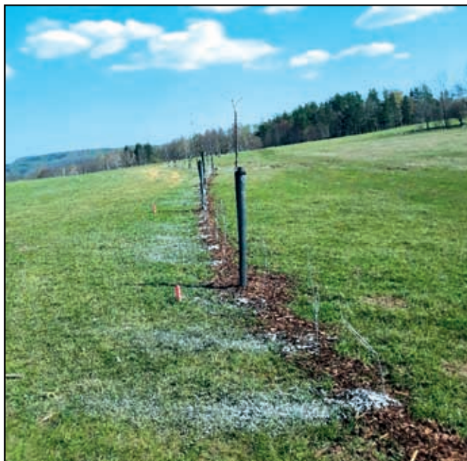
Ovocné stromořadí s podsadbou keřů