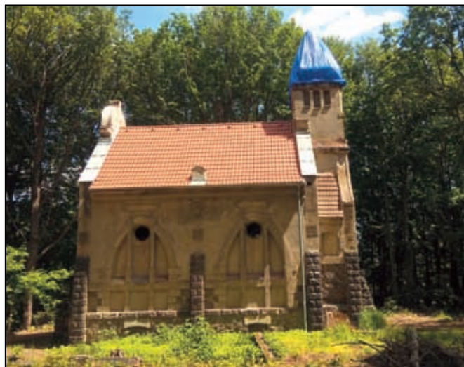
Rekonstrukce střechy v roce 2019

Zaujalo Vás to? Rádi byste se na záchraně podíleli? Je možné zaslat finanční dar na účet u KB a.s. 115-5207170237/0100 - uzavřeme s Vámi darovací smlouvu a vystavíme potvrzení o daru - kontaktujte nás prosím. Další informace o dění kolem kaple na fcb profil kaplelibouchec a na www.kaplelibouchec.cz