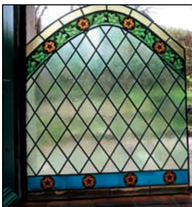
Vitráže vyrobené pro kapli v roce 2020