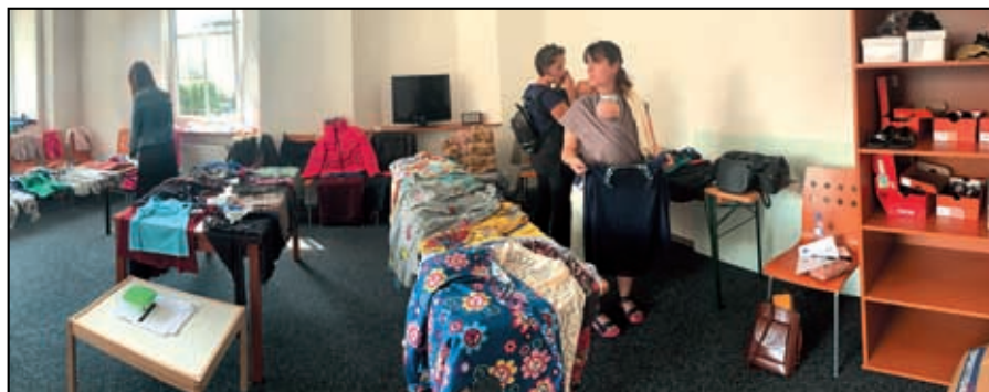
Letní bazar oblečení v Komunitním centru Povrch