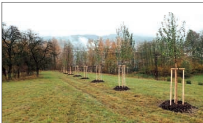
Výsadba alejí v intravilánu obce Malšovice

3. Likvidace křídlatky na Benešovsku a osvětová činnost, žadatel Sdružení obcí Benešovska, náklady 1 005 534,- Kč. Akce je schválena, v současné době se připravuje výběrové řízení na dodavatele, samotná realizace pak bude zahájena v roce 2021 a bude trvat tři roky. Cílem akce je likvidace křídlatky na ucelené lokalitě Benešovska a seznámení veřejnosti s problematikou křídlatky, jako invazního druhu prostřednictvím osvěty.