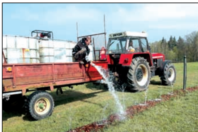
Následná péče o vysazené dřeviny

2. Revitalizace sídelní zeleně v katastru obce Malšovice, žadatel obec Malšovice, náklady 1 186 100,- Kč, akce byla realizována v letošním roce a žadatele čekají tři následné péče o výsadby, které jsou rovněž součástí dotace. Jednalo se o obnovu zeleně na návsi v Malšovících a Javorech a výsadbu alejí v intravilánu obce Malšovice.