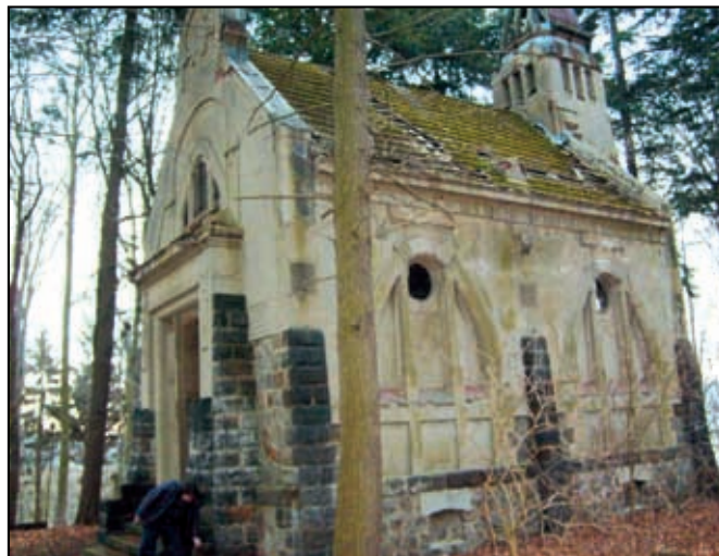
Původní stav v roce 2017