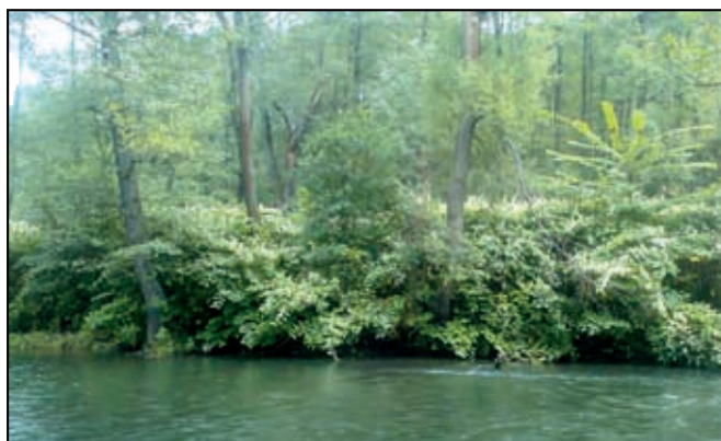
Výskyt křídlatky podél vodních toků

3. Likvidace křídlatky na Benešovsku a osvětová činnost, žadatel Sdružení obcí Benešovska, náklady 1 005 534,- Kč. Akce je schválena, v současné době se připravuje výběrové řízení na dodavatele, samotná realizace pak bude zahájena v roce 2021 a bude trvat tři roky. Cílem akce je likvidace křídlatky na ucelené lokalitě Benešovska a seznámení veřejnosti s problematikou křídlatky, jako invazního druhu prostřednictvím osvěty.