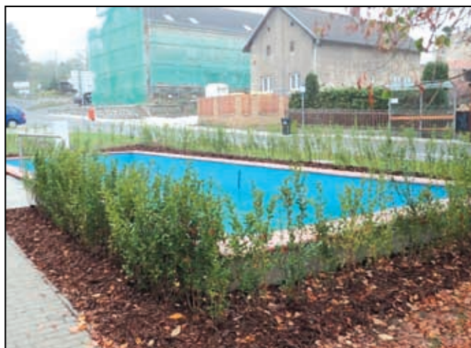
Výsadba na návsi v Malšovících

2. Revitalizace sídelní zeleně v katastru obce Malšovice, žadatel obec Malšovice, náklady 1 186 100,- Kč, akce byla realizována v letošním roce a žadatele čekají tři následné péče o výsadby, které jsou rovněž součástí dotace. Jednalo se o obnovu zeleně na návsi v Malšovících a Javorech a výsadbu alejí v intravilánu obce Malšovice.